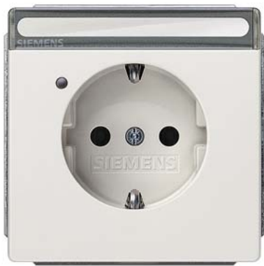
DELTA style titanweiß SCHUKO Kinders/Betriebsanzeige, Schriftfeld 68x68mm 10/16A 250V