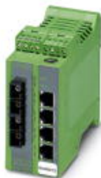
Ethernet Lean Managed Switch mit vier 10/100 MBit/s RJ45-Ports und zwei 10/100 MBit/s FX-SC-Multimode-Ports

Bitte beachten Sie, dass die hier angegebenen Daten dem Online-Katalog entnommen sind. Die vollständigen Informationen und Daten entnehmen Sie bitte der Anwenderdokumentation. Es gelten die Allgemeinen Nutzungsbedingungen für Internet-Downloads. ( http://phoenixcontact.de/download )