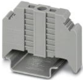
终端固定件，宽度：9.5 mm，颜色：灰色

Please be informed that the data shown in this PDF Document is generated from our Online Catalog. Please find the complete data in the user's documentation. Our General Terms of Use for Downloads are valid ( http://download.phoenixcontact.com )