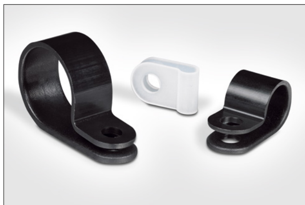
Brides plastiques, à visser, de la série HP.