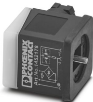
阀连接器，通用，3-位置，阀连接器 A，螺钉连接，电缆密封 M20 x 1.5，电缆外径 6 mm ... 8 mm

请注意，本PDF文档中所示数据均生成自在线目录。完整数据请见用户文档。我们的一般下载使用条款已生效。