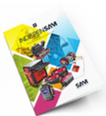
Les outils Indispensables 2021

Découvrez tous nos produits dans nos catalogues en ligne