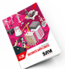
Sécurité anti-chute 2020