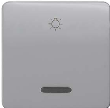
DELTA profil silber Wippe mit Fenster und Lichtsymbol 65x65mm