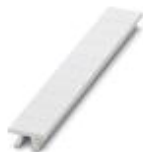
Repérage ZB, à commander : par bandes, blanc, impression selon les indications du client, type de montage: encliquetage dans la rainure de repérage élevée, pour bloc de jonction au pas de : 8,2 mm, surface utile: 10,5 x 8,15 mm

Repères pour blocs de jonction - UC-TM 8 CUS - 0824597