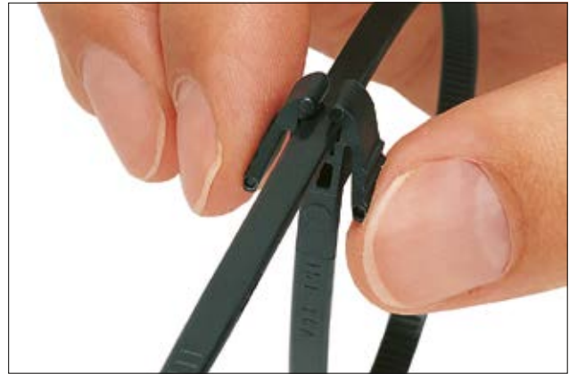
Der REZ-Kabelbinder lässt sich mit nur einer Hand einfach wieder öffnen.