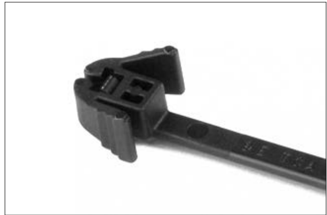
Der REZ-Kabelbinder mit ergonomischem Wiederöffnungsverschluss.