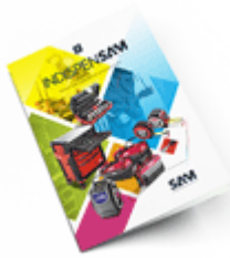
Les outils Indispensables 2021

Découvrez tous nos produits dans nos catalogues en ligne