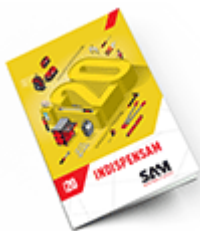
Les outils Indispensables SAM 2020

Découvrez tous nos produits dans nos catalogues en ligne