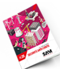
Sécurité anti-chute 2020