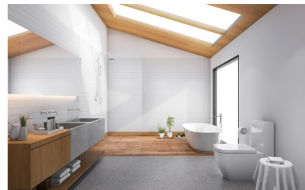
Utilizzabile sia su materiali lisci che porosi.