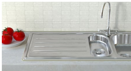
Adatto anche in ambienti umidi.