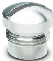
M12高级钢旋入式封盖，用于传感器/执行器电缆、分线盒以及插座上未使用的M12孔式连接位，适用食品工业

请注意，本PDF文档中所示数据均生成自在线目录。完整数据请见用户文档。我们的一般下载使用条款已生效。