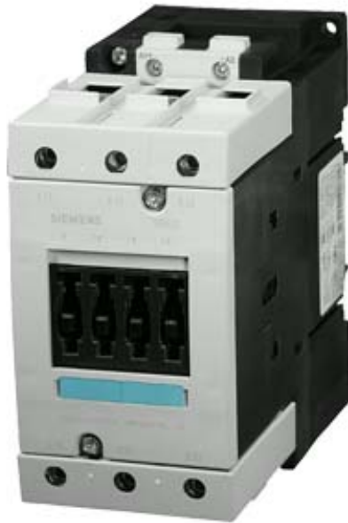
SCHÜTZ, AC-3, 45KW/400V, DC 24V, 3POLIG, BGR. S3, SCHRAUBANSCHLUSS