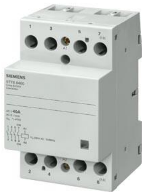
Insta-Schutz mit 4 Öffnern Kontakt für AC 230V, 400V 63A Ansteuerung AC 24V