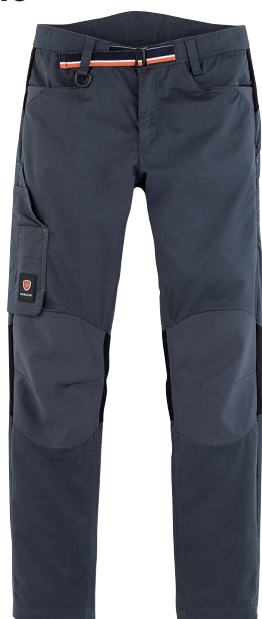
■ 1753 PARADE GRAU