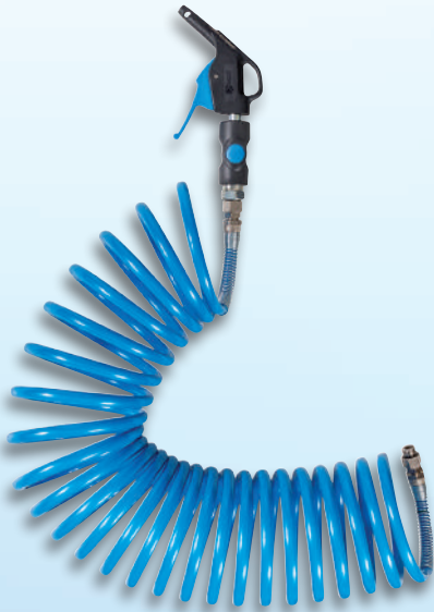
Raccords fixes aux deux extrémités du tuyau spiralé