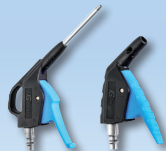
Produits associés : IBG 06MTL – IPG 06OSH