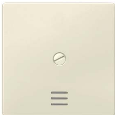
DELTA i-system elektroweiß Wippe schraubbar mit Fenster 55x55mm