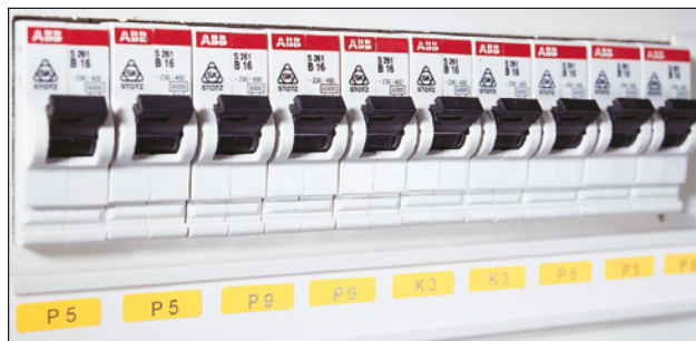
Identificazione di un quadro elettrico.