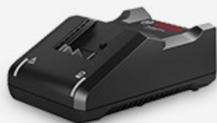
充电器 GAL 18V-40