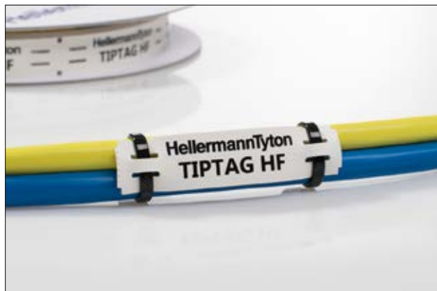
TIPTAG HF – Bedruckbare Kennzeichnungsschilder.