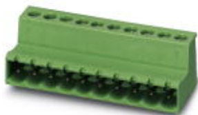
图为10位穿墙式连接器

插拔式连接器，标称工作电流: 12 A，位数: 4，针距: 5.08 mm，接线方式: 带压片的螺钉连接，颜色: 绿色，触点表面: 锡