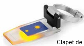
Clapet de prisme avec LED ORA-A1101