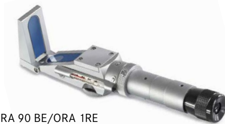
ORA 90 BE/ORA 1RE