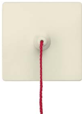
DELTA i-system elektroweiß Wippe mit Zugbetätigung für Taster 55x55mm