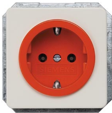
DELTA profil titanweiß SCHUKO orange Näpfchen(ZSV) 10/16A 250V 65x 65mm