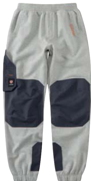
■ 1413 DUNKEL GRAU