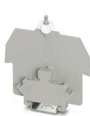
可密封盖板，安装在NS 35/7,5 DIN导轨上，用于AP 3保护盖，带塑料M5滚花螺母，空间要求：13 mm

请注意，本PDF文档中所示数据均生成自在线目录。完整数据请见用户文档。我们的一般下载使用条款已生效。