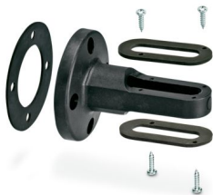
Winkel für zweiseitige Bodenmontage, verdeckte Kabelführung, schwarz

Bitte beachten Sie, dass die in diesem PDF-Dokument angezeigten Daten aus unserem Online-Katalog generiert wurden. Bitte finden Sie die vollständigen Daten in der Benutzer-Dokumentation. Es gelten unsere Allgemeinen Nutzungsbedingungen für Downloads.