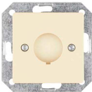
DELTA i-system gelb Abdeckplatte für Einbau- Befehlsgerät, D=22,5mm 55x55mm