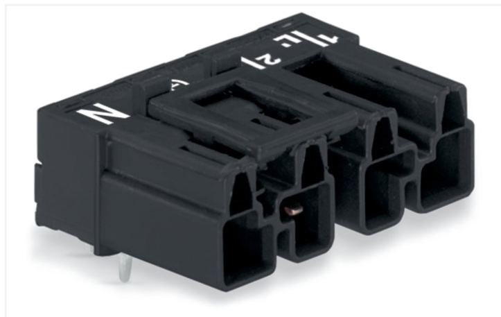
Couleur: ■ noir