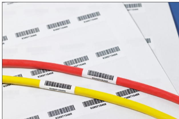
Laminering gir lang holdbarhet.