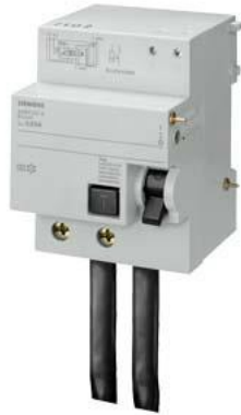
FI-Block , 2-polig, Typ AC, In: 100 A, 30 mA, Un AC: 230 V, für 5SP4