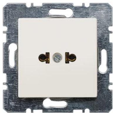
DELTA i-system titanweiß SCHUKO 15A 125V amerik. Standard C73 51x 51mm