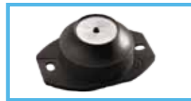
Suspensions en élastomère