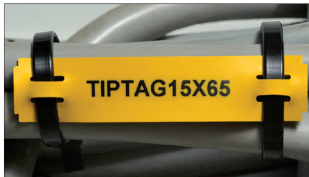
TIPTAG - markeren van kabelbundelingen en componenten.