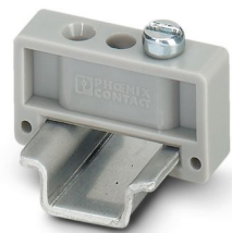
终端固定件，宽度：6.2 mm，颜色：灰色

请注意，本PDF文档中所示数据均生成自在线目录。完整数据请见用户文档。我们的一般下载使用条款已生效。