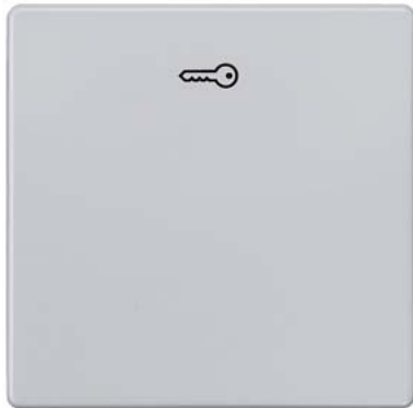
DELTA i-system aluminiummetallic Wippe mit Symbol Türöffner 55x55mm