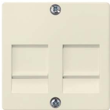
DELTA i-system elektroweiß Abdeckung mit Verschluss für Modular Jack 55x55mm