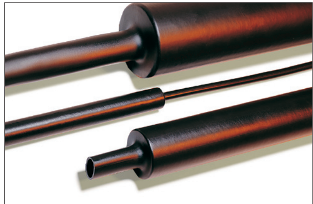
Middelwandige krimpkous - met of zonder lijmlaag.

Voorgesneden lengten zijn op aanvraag leverbaar. Neem contact met ons op!