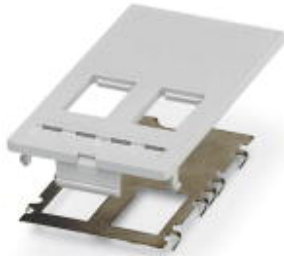
前端板，塑料，带屏蔽框架，可安装2组模块化 (Keystone) RJ插芯

Please be informed that the data shown in this PDF Document is generated from our Online Catalog. Please find the complete data in the user's documentation. Our General Terms of Use for Downloads are valid ( http://download.phoenixcontact.com )