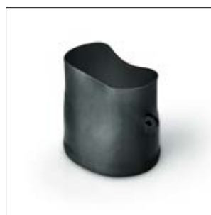
Helashrink Serie 150 ungeschumpft.