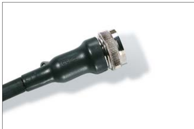
Helashrink Serie 150.

Auf Seite 244 befinden sich Material- und Kleberinformationen.