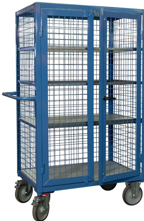
Modèle présenté avec 3 étagères