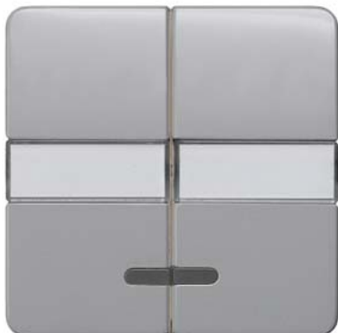
DELTA profil silber Wippe 2-fach mit Schriftfeld und Fenster 65x65mm