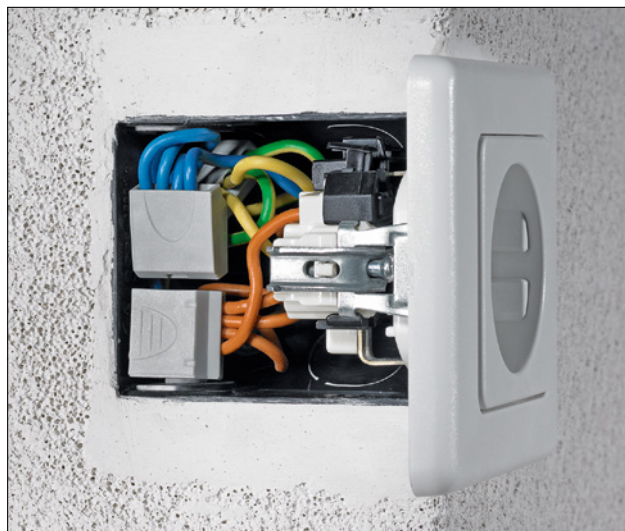
Grazie al suo design compatto HelaCon Easy è utile dove gli spazi sono limitati.