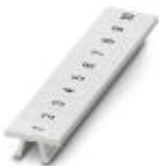
Zackband, Streifen, weiß, beschriftet, längs bedruckt: fortlaufende Zahlen 1 ... 10, 11 ... 20 usw. bis 491 ... 500, Montageart: verrasten in hoher Schildchennut, für Klemmenbreite: 5,2 mm, Schriftfeldgröße: 5,15 x 10,5 mm

Zackband - ZB 5,LGS:FORTL.ZAHLEN - 1050017