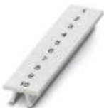
Zackband, weiß, quer bedruckt: fortlaufende Zahlen 1 ... 10, 11 ... 20 usw. bis 491 ... 500, Montageart: verrasten in hoher Schildchennut, für Klemmenbreite: 5,2 mm, Schriftfeldgröße: 5,15 x 10,5 mm

Zackband - ZB 5,QR:FORTL.ZAHLEN - 1050020