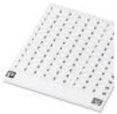
マーキングカード, カード, 白, マーキング, 横: 連番 ( 1~10、11~20など、91~100まで ), 取付けタイプ: 粘着剤, 端子台幅 : 7.62 mm, 印字エリア: 7,62 x 3,8 mm

マーキングカード - SK 7,62/3,8:FORTL.ZAHLEN - 0804549