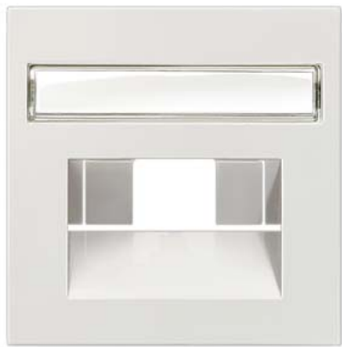
DELTA profil silber Abdeckung UAE-Kat.3, 1-und2f mit Schriftfeld 65x 65mm