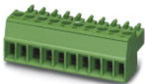
图为10位穿墙式连接器

插拔式连接器，标称工作电流: 8 A，位数: 8，针距: 3.81 mm，接线方式: 带压片的螺钉连接，颜色: 绿色，触点表面: 锡