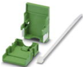
电缆插头外壳，针距: 3.81 mm，位数: 3，尺寸a: 13.82 mm，颜色: 绿色

Please be informed that the data shown in this PDF Document is generated from our Online Catalog. Please find the complete data in the user's documentation. Our General Terms of Use for Downloads are valid ( http://download.phoenixcontact.com )