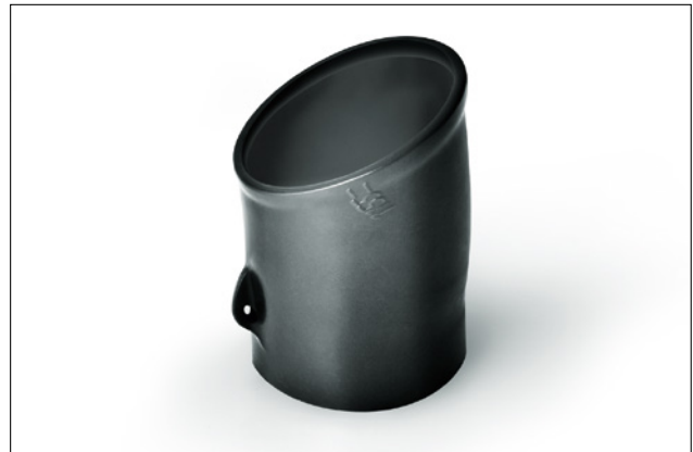
1155-4 según se suministra.

Para información sobre Materiales/ Adhesivos, por favor refierase a la pag. 200.