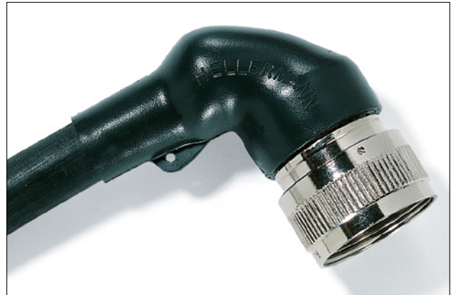
1152-4-G Contraída sobre conector.